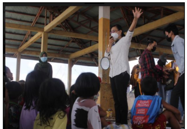
Gambar 1. Penyuluhan Kesehatan

Penyuluhan secara langsung dengan metode interaktif melalui bermain , bernyanyi dan berdiskusi