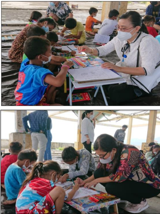
Gambar 2. Menggambar dan mewarnai

untuk memperkenalkan kepada mereka cara pencegahan penularan COVID-19. Oleh karena itu, kami menyediakan berbagai gambar protokol pencegahan COVID-19 yang dapat diwarnai atau digambar oleh anak-anak agar mereka lebih tertarik.