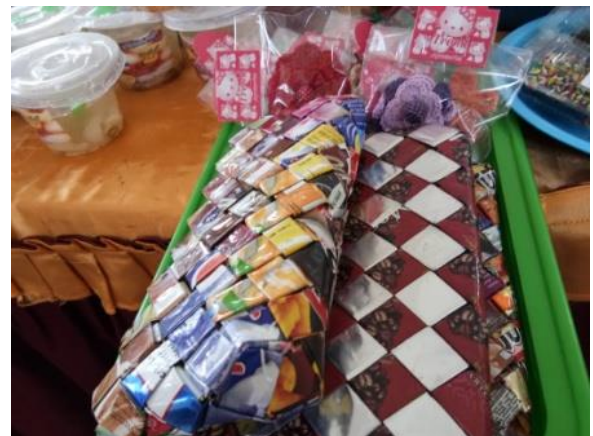
Gambar 1. Hasil daur ulang sampah

Kegiatan kedua yang dilakukan adalah melakukan FGD dan pendampingan tentang perilaku hygiene dan membangun desa sanitasi total berbasis masyarakat. Pelaksanaan penyuluhan dan FGD dapat dilihat di gambar 2. Kegiatan pengembangan sarana sanitasi secara partisipatif dengan metode Sanitasi Total Berbasis Masyarakat dilakukan dengan memicu anggota masyarakat yang memiliki kebiasaan perilaku BAB di tempat terbuka atau sembarang tempat. Proses pemucuan dilakukan pada lingkungan yang lebih kecil misalnya proses pemucuan dilakukan pada anggota masyarakat dalam satu dusun. Keuntungan yang didapatkan bila proses pemucuan pada lingkungan masyarakat yang kecil adalah proses pemucuan dapat lebih intensif dan monitoring dapat lebih mudah ditindaklanjuti.