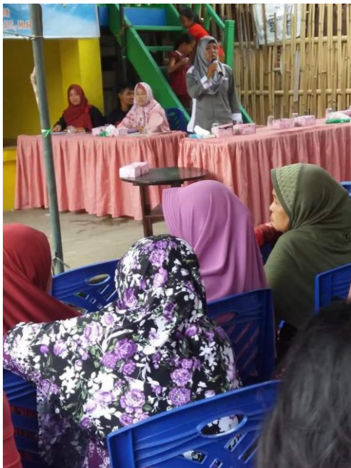
Gambar 2. Pelaksanaan penyuluhan dan FGD

Ada beberapa langkah pendampingan yang dilakukan sebagai upaya meningkatkan perilaku higienis dan membangun desa sanitasi total berbasis masyarakat. Langkah pertama yang dilakukan dalam memicu sanitasi total berbasis masyarakat mengajak masyarakat merubah perilaku membuang sampah dan buang air besar di sungai. Langkah kedua adalah pengenalan peta dan lingkungan desa. Pengenalan lingkungan desa dimaksud adalah mengetahui kondisi kehidupan masyarakat berupa kebiasaan musim dan kebiasaan-kebiasaan lain masyarakat, mengetahui kondisi kesehatan masyarakat berupa pola penyakit yang berbasis lingkungan serta kondisi sosial ekonomi. Langkah ketiga adalah pengenalan tokoh masyarakat. Tokoh masyarakat adalah orang-orang yang memiliki kemampuan untuk mempengaruhi orang lain. Dalam suatu masyarakat biasanya orang-orang tertentu yang menjadi tempat bertanya dan tempat meminta nasehat anggota masyarakat lainnya mengenai urusan-urusan tertentu.