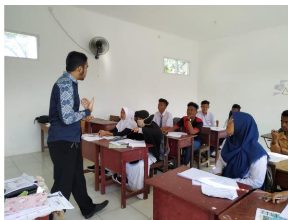
Gambar 7. Pengabdi juga memberikan motivasi bahwasannya siswa/i SKB Balikpapan Timur sangat hebat

Dalam pelaksanaannya pula, guru juga perlu memberikan soal-soal cerita yang berkaitan dengan permasalahan kehidupan sehari-hari, terlebih soal teka-teki logika. Rahardjo & Waluyati (Muncarno & Yulina, 2017) menyatakan bahwa secara garis besar kesulitan siswa dalam menyelesaikan soal cerita yaitu kesulitan dalam memahami masalah (soal), kesulitan dalam menyusun rencana penyelesaian, kesulitan dalam menyelesaikan rencana, kesulitan dalam melihat (mengecek) kembali hasil yang telah diperoleh, dan kesulitan dalam menginterpretasikan jawaban tersebut terhadap situasi permasalahan yang terdapat dalam soal.