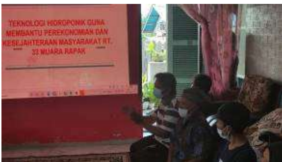
Gambar 4. Sosialisasi KKN dan hidroponik

Kegiatan sosialisasi kepada warga RT 33 Muara Rapak seperti pada Gambar 4 dibagi menjadi 2 materi, yaitu tahapan kegiatan KKN yang dilakukan dan bagaimana cara memanfaatkan lahan sempit sebagai media hidroponik. Pada tahap ini telah diputuskan kegiatan awal yang akan dilakukan setelah sosialisasi, yaitu pembuatan kerangka hidroponik, pembibitan sayur, pemindahan bibit sayur, dan pemanenan sayur.