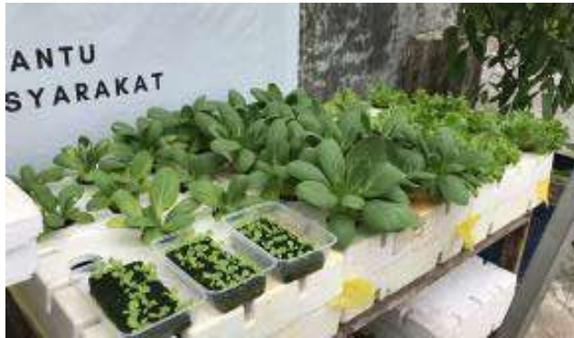
Gambar 1. Tanaman Hidroponik

khususnya tanaman hortikultura meliputi tanaman sayuran, buah-buahan, hias dan biofarmaka, tetapi memiliki lahan yang terbatas (Susilawati, 2019). Penduduk yang tinggal di wilayah perkotaan umumnya memiliki lahan sempit yang tidak cukup untuk bertanam secara konvensional, tetapi cocok untuk penerapan sistem tanam hidroponik (Lestari dkk, 2020). Gambar 1 menunjukkan tanaman yang ditanam menggunakan sistem hidroponik.