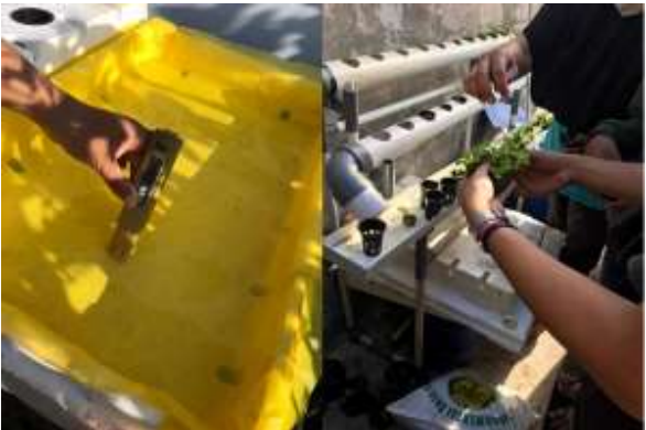
Gambar 8. Pengukuran PH/PPM dan Proses Pemandahan Tanaman

Tahap ini diawali dengan pengisian air pada wadah, kemudian dilanjutkan dengan pemberian nutrisi hidroponik sesuai dengan kadar PH dan PPM yang dibutuhkan tanaman yang akan ditanam. Pada pemindahan ini tanaman yang siap untuk dipindahkan adalah selada dan pakchoi yang telah berumur kurang lebih 1 minggu. Proses tersebut terlihat pada Gambar 8. Dalam satu wadah dapat diisi dengan 2 jenis tanaman secara langsung. Proses perawatan dilakukan hingga tanaman siap panen. Hal yang perlu dikontrol adalah tingkat PH air dan kadar PPM nutrisi yang terkandung dalam air. Selain itu pengecekan hama juga perlu dilakukan.