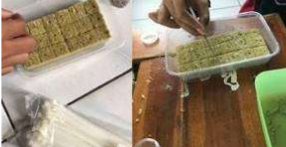
Gambar 7. Proses penyemaian

hidroponik. Kemudian dilanjutkan dengan proses penyemaian bibit pada rockwool dengan memulai menanam bibit selada, pakchoi, dan bayam seperti yang ditunjukkan pada Gambar 7. Setiap potong rockwool biasanya satu biji bibit. Ini dilakukan agar tanaman dapat tumbuh dengan baik tanpa saling mengganggu.