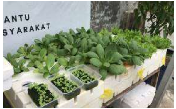
Gambar 9. Tanaman hidroponik yang siap dipanen

biasanya lebih cepat panen dibandingkan metode konvensional (Irawati & Widodo, 2017).