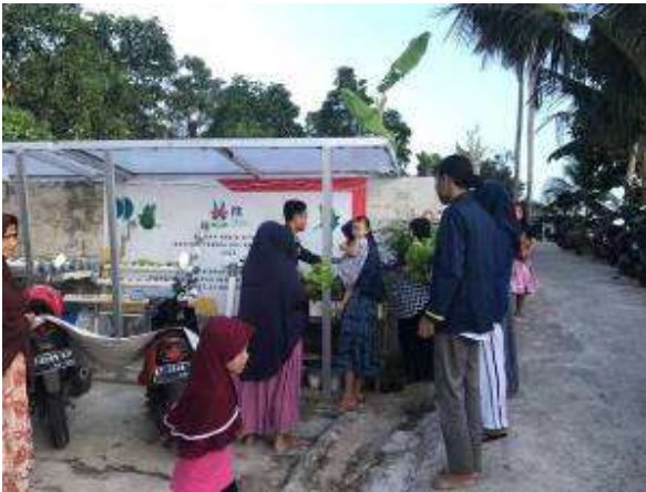
Gambar 11. Pembagian hasil panen

Seperti telah disebutkan sebelumnya umur panen tanaman hidroponik lebih cepat dibandingkan tanaman konvensional. Penelitian yang dilakukan oleh Nurmayulis dkk (Nurmayulis & Jannah, 2014), selada yang ditanam pada tanah dengan beberapa variasi bahan organik kotoran ayam dan bioaktivator dipanen dalam waktu rata-rata 42 hari. Berdasarkan pengamatan yang dilakukan oleh Rantung dkk (2020), ketika disimpan dalam mesin pendingin, tanaman hidroponik memiliki laju pencokelatan lebih lambat dibandingkan yang ditanam pada media tanah. Reaksi pencokelatan ini yang kemudian berlanjut menjadi pembusukan sayur-sayuran. Hal ini kemungkinan disebabkan karena selada yang ditanam di tanah rentan terkontaminasi oleh mikroorganisme pembusuk. Walaupun demikian, laju penyusutan yang dialami oleh selada hidroponik lebih tinggi dibandingkan selada tanah karena secara teoretis, selada hidroponik memiliki laju transpirasi yang lebih besar.