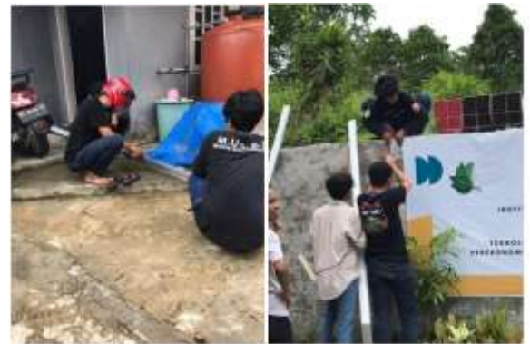
Gambar 5. Proses awal pembuatan kerangka

kemudian dilanjutkan dengan pemasangan baja ringan pada tembok penyangga seperti tersaji pada Gambar 5.