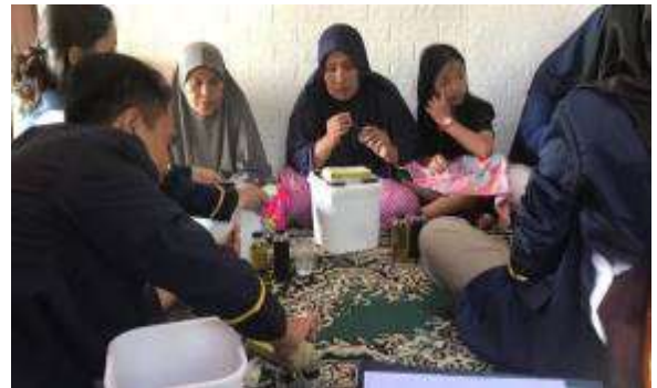
Gambar 10. Kegiatan pelatihan

Pada akhir kegiatan, dilakukan pelatihan yang terdiri dari penjelasan materi hidroponik dan praktik menyiapkan tempat pembibitan dan penyemaian bibit. Setiap warga yang hadir diberikan 1 set alat untuk latihan sistem hidroponik, khususnya Sistem Sumbu yang terdiri dari wadah, bibit, rockwool , dan nutrisi. Warga yang hadir cukup antusias dalam belajar mengenai hidroponik ditunjukkan pada Gambar 10 dan pengetahuan akan hidroponik menjadi bertambah. Hasil penyemaian bibit dan 1 set alat tersebut kemudian digunakan warga sebagai latihan awal di rumah masing-masing.