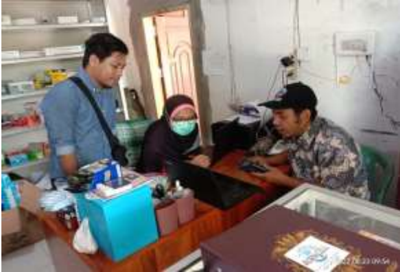
Gambar 3. Pengujian/Implementasi 1

aplikasi yang akan diimplementasikan bila memungkinkan (Jaya, 2018).