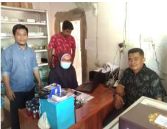
Gambar 4. Pengujian/Implementasi 2

Pengujian tahap 2 setelah dilakukan perbaikan sesuai keinginan pengguna aplikasi. Tujuan pengujian perangkat lunak adalah untuk meningkatkan rasa percaya diri pengembang perangkat lunak terhadap fungsi-fungsi perangkat lunaknya setelah dilakukan beberapa kali uji pengujian aplikasi yang akan diimplementasikan oleh pengguna aplikasi (Simarmata, 2010). Melakukan pengujian fungsionalitas sistem untuk memastikan semua fungsi sistem berjalan sesuai dengan seharusnya (Ningsi ddk, 2021).