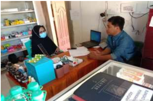
Gambar 1. Analisis Kebutuhan

Analisis kebutuhan bertujuan untuk mengetahui permasalahan apa saja yang ada untuk membantu pemilik apotek dalam mencatat transaksi penjualan obat. Tahapan analisa kebutuhan adalah pengumpulan informasi masalah melalui observasi serta menganalisa mengenai data masukan dan luaran sistem, fitur apa saja yang ada di dalam sistem, dan siapa saja yang terlibat dalam sistem (Fauzi et al., 2018). Analisis kebutuhan dilakukan untuk mendapatkan suatu informasi yang dibutuhkan oleh pengguna (Kirana & Wahdaniyah, 2018).