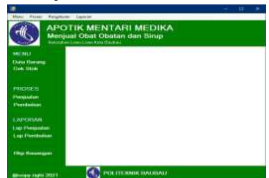
Gambar 5. Tampilan Menu Admin