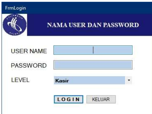
Gambar 7. Tampilan Menu Login Kasir

b) Log in Kasir yaitu fokus pada transaksi penjualan barang (obat). Pada menu ini, sistem akan mengontrol kesediaan stok penjualan sehingga kasir mengetahui secara pasti jumlah stok saat ini sebelum melakukan transaksi. Menu ini juga memudahkan kasir dalam menghitung total pembelian pelanggan tanpa menggunakan kalkulator.