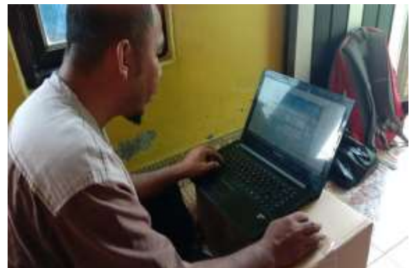
Gambar 2. Perancangan Aplikasi

Aplikasi yang dirancang bersifat user friendly , agar pengguna dengan mudah mengoperasikan aplikasi yang dibuat. Tahap desain sistem bertujuan memodelkan aplikasi yang akan diimplementasikan nantinya (Anwar et al., 2013). Perancangan software atau aplikasi bertujuan untuk memberikan gambaran apa yang seharusnya dikerjakan oleh software (Ariyanti, 2019).