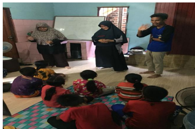
Gambar 2 Proses belajar mengajar

Dalam proses belajar mengajar di panji berbakat, juga dilakukan evaluasi berupa test akhir pengajaran.