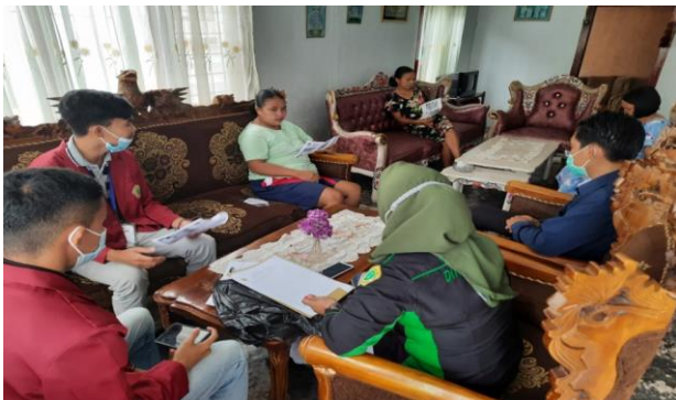
Gambar 2. Warga antusias mengikuti penyuluhan dengan aktif bertanya tentang materi yang diberikan dengan media yang digunakan adalah leaflet