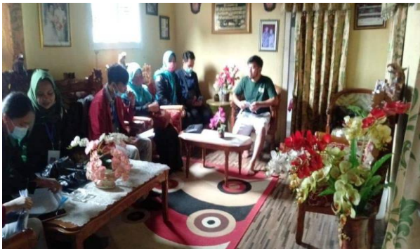
Gambar 1. Penyuluhan kesehatan tentang pencegahan penyakit tidak menular (PTM) yang dilakukan secara door to door ke rumah warga

masyarakat dapat memahami materi penyuluhan dengan santai dan memberikan pengalaman belajar mandiri kepada masyarakat. Gambar 2 menunjukkan masyarakat sangat antusias mengikuti penyuluhan kesehatan dengan aktif bertanya dan memberikan komentar terhadap materi penyuluhan yang diberikan. Sesi tanya jawab dimasukkan agar masyarakat dapat menyerap materi tentang upaya pencegahan penyakit tidak menular secara maksimal. Gambar 3 menunjukkan kegiatan pengabdian ini dilaksanakan atas kerjasama dengan aparat pemerintah Desa Moyag, Puskesmas Kotobangon Poskesdes Moyag, dan mahasiswa Fakultas Ilmu Kesehatan Institut Kesehatan dan Teknologi Graha Medika.