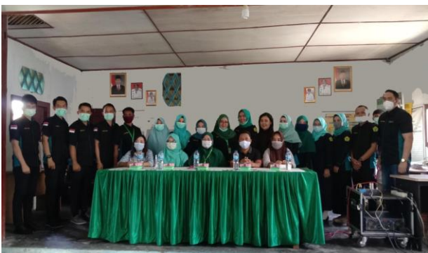
Gambar 3. Foto bersama dengan aparat desa dan stakeholder Kecamatan Kotamobagu Timur sebagai bentuk dukungan terhadap kegiatan pengabdian

Tabel 1 menunjukkan bahwa rata-rata skor pengetahuan masyarakat tentang pencegahan penyakit tidak menular (PTM) pada saat pre-test adalah 12,43 dengan standar deviasi 1,620, dan pada saat post-test meningkat menjadi 17,14 dengan standar deviasi 1,737. Skor pengetahuan terendah pada saat pre-test adalah 9 dan skor tertinggi adalah 13 dan pada saat post-test skor pengetahuan terendah pada adalah 16 dan skor tertinggi adalah 20. Berdasarkan hasil analisis terdapat perbedaan nilai rata-rata skor pengetahuan masyarakat penyuluhan pada saat pre-test dan post-test dengan angka 4,71 (Grafik 1). Hal ini menunjukkan bahwa ada peningkatan pengetahuan peserta penyuluhan setelah diberikan penyuluhan kesehatan berupa edukasi CERDIK.